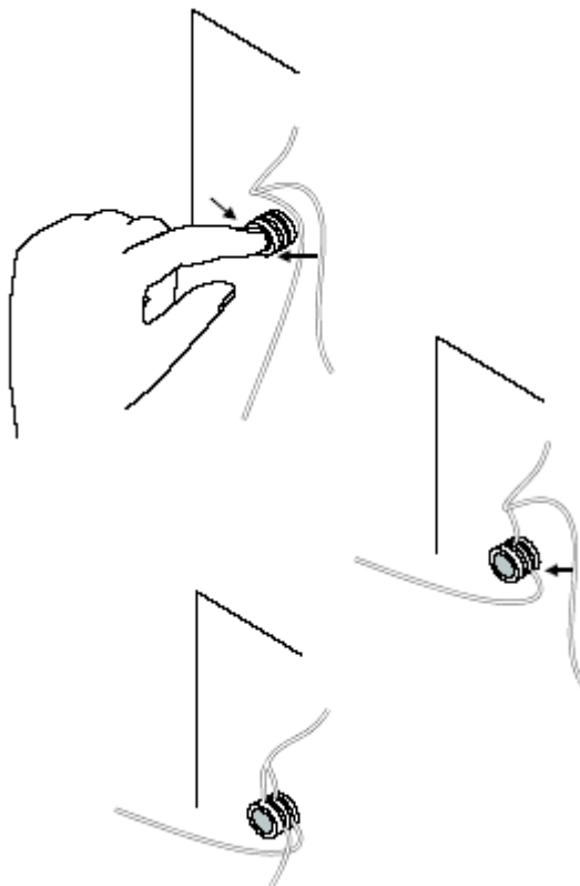
图 6 在夹紧式胶管阀内安装管道